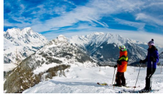
A Courmayeur arriva Le Massif di Italian Hospitality Collection 15 aprile 2017