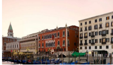
Hotel Danieli a Venezia: una leggenda da "rinfrescare" 29 aprile 2017