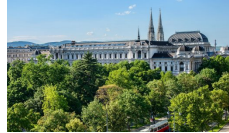
10 città nel mondo dove vivere (al meglio) 13 aprile 2017