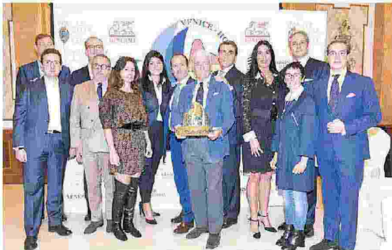
La presentazione nella cornice del The Gritti Palace di Venezia