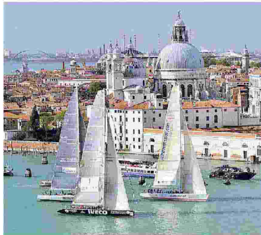
La manifestazione l'anno scorso nel bacino di San Marco