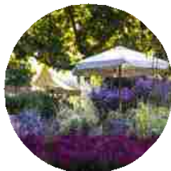
Orticolaria 2015 Villa Erba, Lago di Como, tutte le info