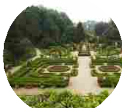
Giardinity 2015: l'evento per tutti gli esperti e appassionati di gardening