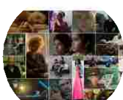
Festa del Cinema di Roma 2015, tutte le info