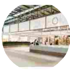
Homi Milano settembre 2015: tutte le info