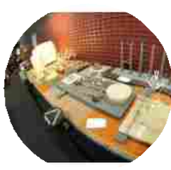
Abitare il tempo, il salone del settore arredo e design a Verona, tutte le info