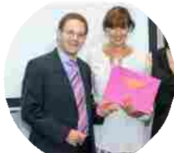
Veraclasse vince il Premio Stampa Israele 2015